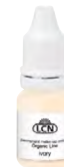
Organic Line ivory, 10 ml N. art.: 92381-1