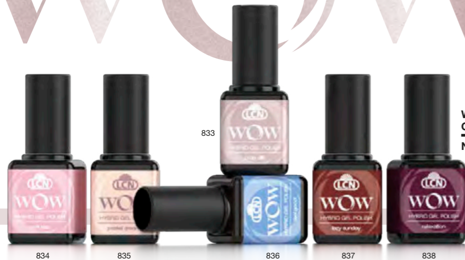
WOW HYBRID GEL POLISH, 8 ML N. art.: 45077-..